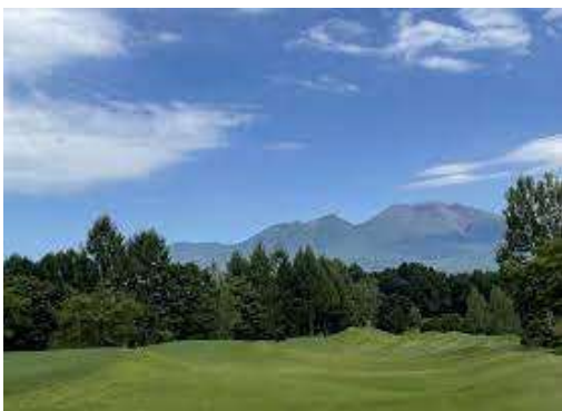
浅間山とゴルフ場

でメダルがとれる感動を味わっては如何ですか? 中軽井沢には、大型スーパーが2店舗あります。ここで土産を買います。新鮮な野菜、果物、お漬物が他店より安く、私はセロリ、山芋の浅漬けを買いました。 このスーパーでは、便利な宅配便の手続きもあります。夕方に軽井沢駅に戻り、アウトレット廻りとお茶をして、夕食用のお弁当と飲み物を用意しました。 18時05分 軽井沢駅発玉川上水駅前經由立川駅行きに乗り、軽井沢をあとにします。 20時49分 玉川上水駅前到着です。家に着くまでが未だ旅の延長で、玄関に入ると本日の旅の終りです。皆様も是非楽しい思い出づくりに「軽井沢に行きましよう♥」